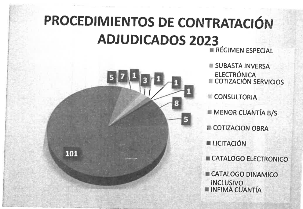
Gráfica 1.- procedimientos de contratación 2023